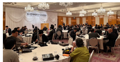
第6回勉強会も満員御礼ありがとうございました。