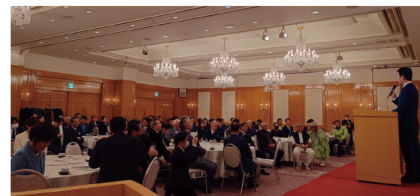
第7回勉強会も満員御礼ありがとうございました。